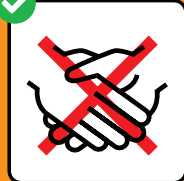
Evitar da dar il maun.