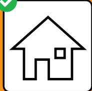
Sch'il test è positiv: isolaziun. En cas da contact cun ina persona cun in test positiv: quarantina.