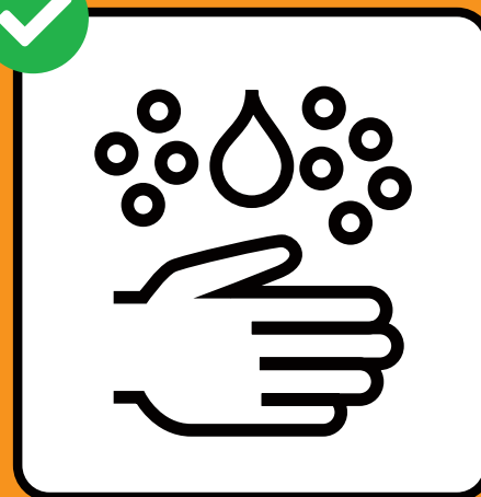
Lavar bain ils mauns.