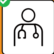
Sa laschar testar immediatamain e restar a chasa en cas da sintoms.