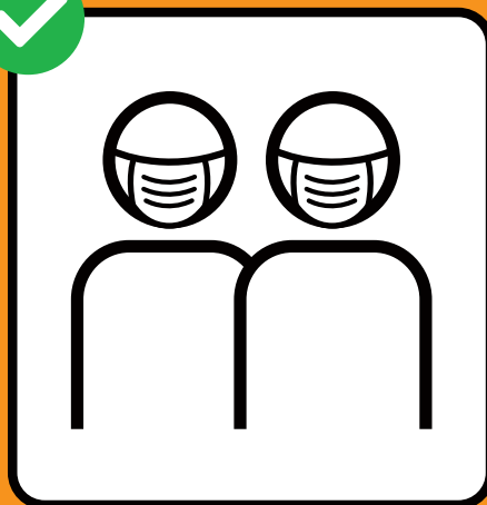
Purtar ina mascrina, sch'i n'è betg pussaivel da tegnair distanza.