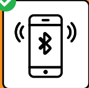
Per franar las chadainas da transmissiun: chargiar giu ed activar l'app SwissCovid.