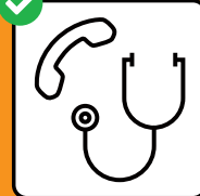
S'annunziar per telefon avant che ir tar il medi u a la staziun d'urgenza.