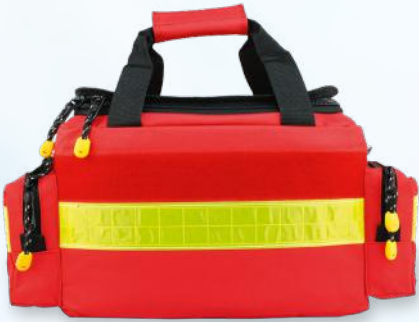
Petit sac d'urgence rouge, 43 × 25 × 27 cm

Les mallettes d'urgence robustes pour les premiers secours offrent une protection fiable pour les ustensiles médicaux. Elles sont robustes, résistantes à l'eau et aux chocs, idéales pour réagir rapidement et efficacement en cas d'urgence.