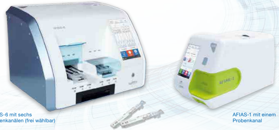
AFIAS-6 mit sechs Probenkanälen (frei wählbar)

Perfekt für die Arztpraxis: Riesiges Analysespektrum. Minimaler Platzbedarf.