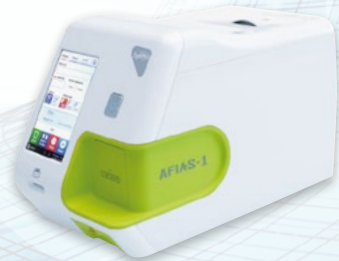
AFIAS-1 mit einem Probenkanal

Die beiden Geräte unterscheiden sich einzig durch die Anzahl der gleichzeitig zu verarbeitenden Parameter: beim AFIAS-6 stehen Ihnen sechs Probenkanäle zur freien Verfügung, der AFIAS-1 bietet einen Probenkanal.