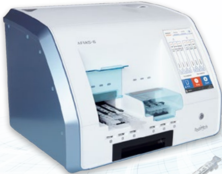
AFIAS-6 mit sechs Probenkanälen (frei wählbar)

Perfekt für die Arztpraxis: Riesiges Analysespektrum. Minimaler Platzbedarf.