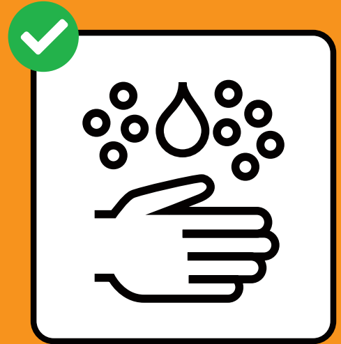
Gründlich Hände waschen.