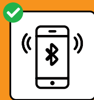
Um Infektions- ketten zu stoppen: SwissCovid App downloaden und aktivieren.