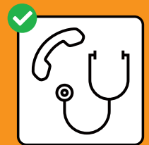
Nur nach telefonischer Anmeldung in Arztpraxis oder Notfallstation.