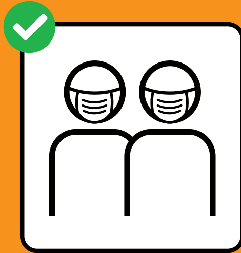
Maske tragen, wenn Abstand- halten nicht möglich ist.