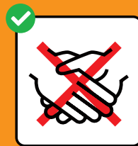
Hände schütteln vermeiden.