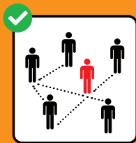
Zur Rückverfol- gung immer vollständige Kontaktdaten angeben.